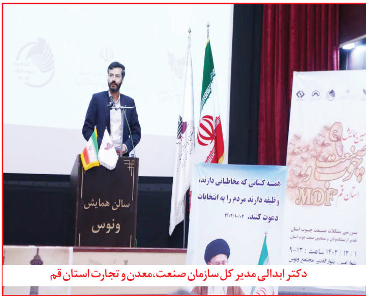
دکتر ابدالی مدیر کل سازمان صنعت، معدن و تجارت استان قم