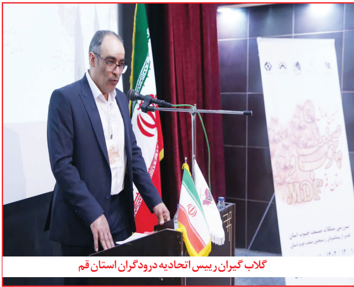
گلاب گیران رییس اتحادیه درودگران استان قم