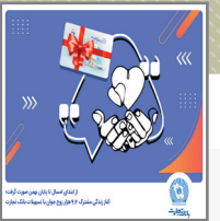
فرزندآوری، گامی بلند را در مسیر تسهیل ازدواج زوج‌های جوان برداشته است.