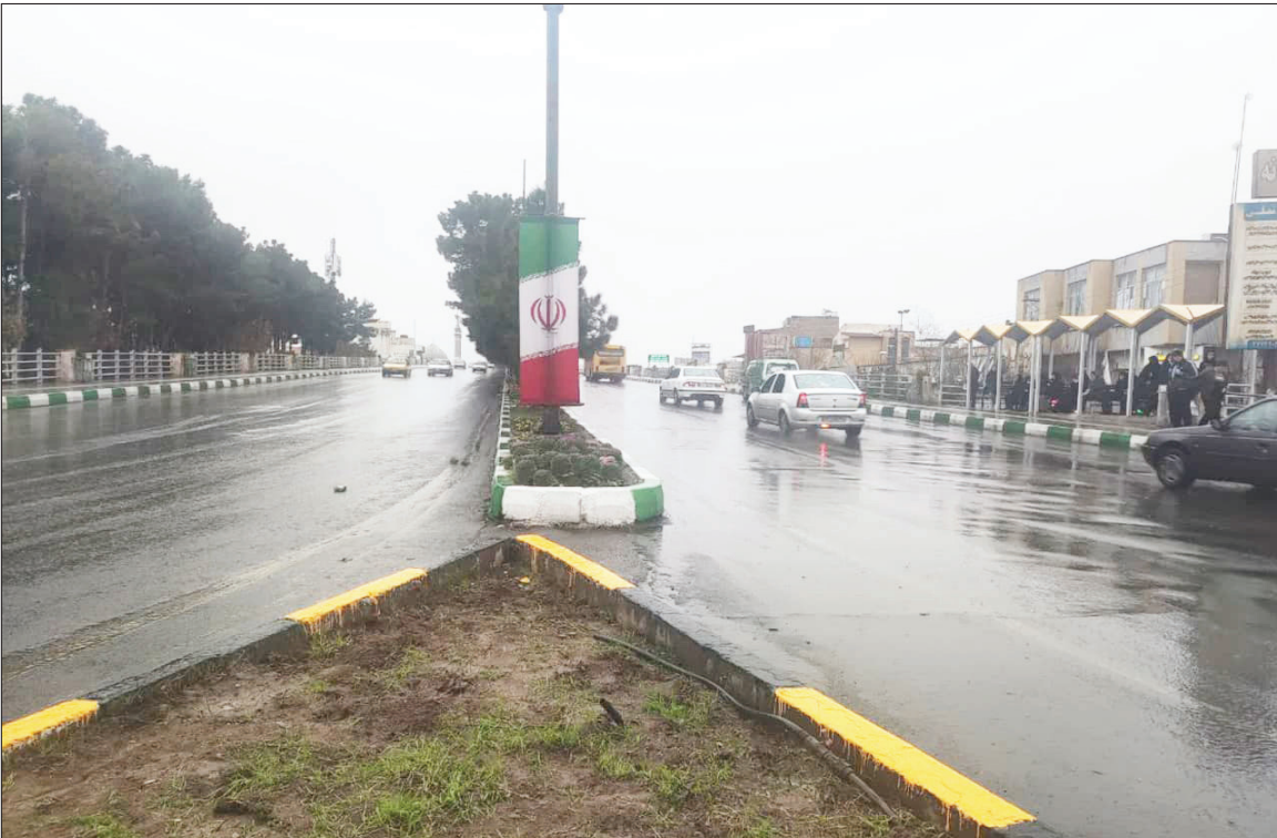
عکس اختصاصی شاخه سبز هره مهر نوروزی

پل بلوار امین قم - تنها پل جهان که روی آن درخت کاشته شده