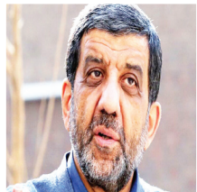
ضرغامی مطرح کرد: