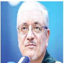
سخنگوی وزارت دفاع:

یارانه تشویقی ۲۲۰ هزار تومانی کالابرگ خلاف قانون است