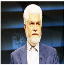
نماینده مردم زاهدان؛