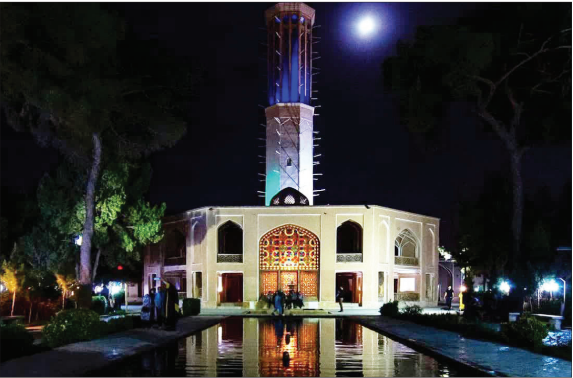
عکس اختصاصی شاخه سبز هیفا پر دل